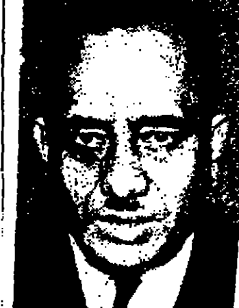
الوزير الفاضل عبد الرحمن عارف

بيروت - اقلبية - اعلنت جبهة الدفاع القومي عن عملياتها داخل الأراضي المحتلة. وقالت الجبهة ان عملياتها هي من اجل تحرير فلسطين وتوحيد فلسطين.